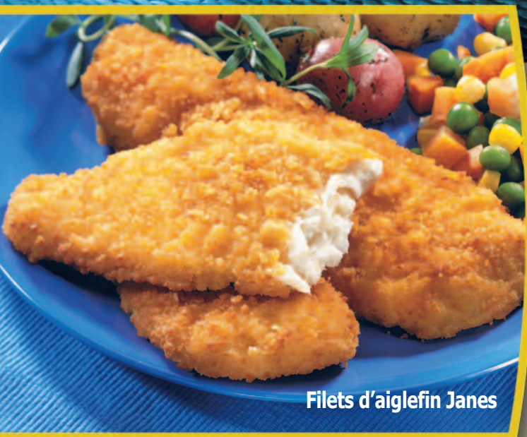
Filets d'aiglefin Janes