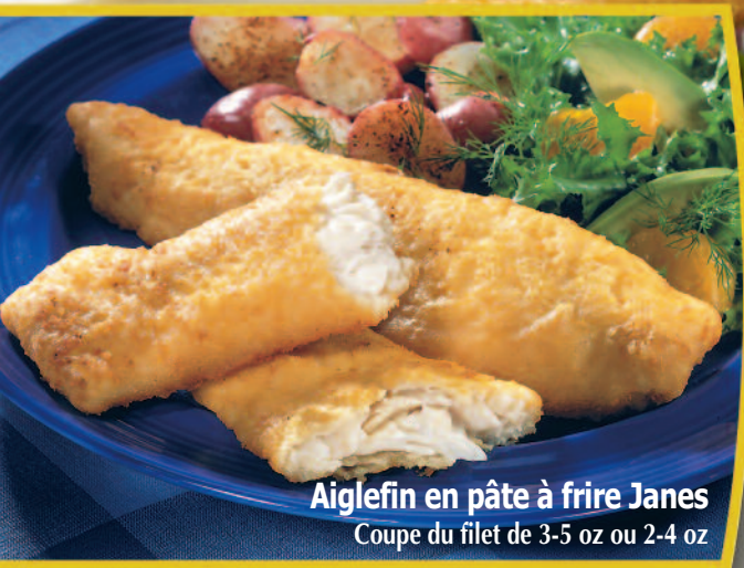
Aiglefin en pâte à frire Janes Coupe du filet de 3-5 oz ou 2-4 oz