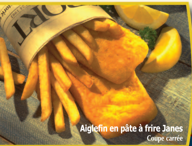
Aiglefin en pâte à frire Janes Coupe carrée